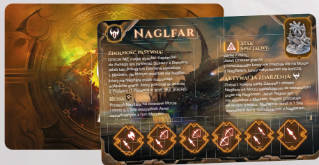
KARTA BOSSA – NAGLFAR