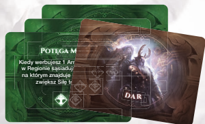
12 KART DARÓW AEGIRA