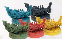
20 FIGUREK SNEKKARÓW FIGURKA BOSSA – (PO 4 W KOLORZE NAGLFAR KAŻDEGO GRACZA)